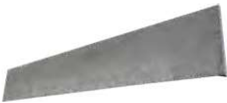
ENKELZIJDIG GLAD / SINGLE LISSE